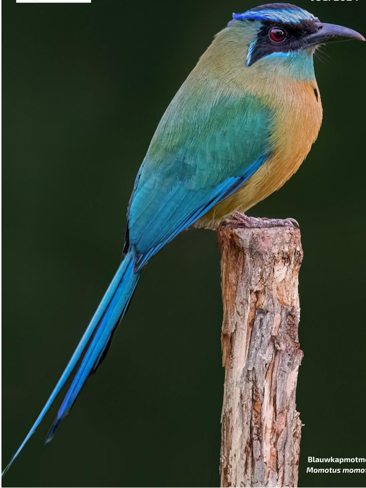
Blauwkapmotmot Momotus momota